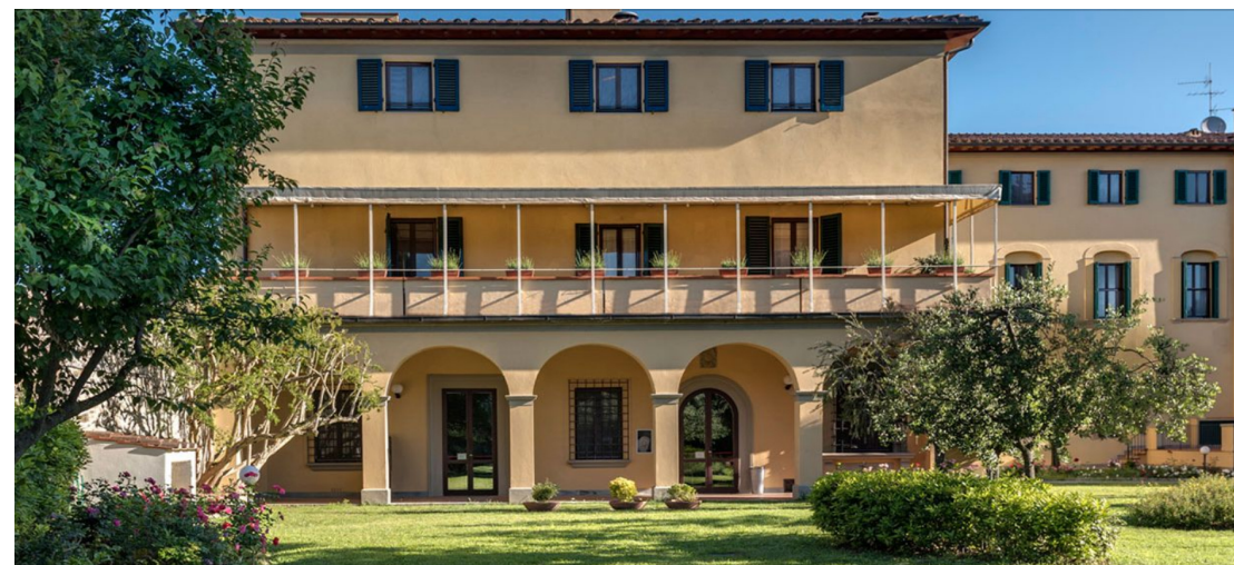
Residenza dei Soci Ascai Villa La Stella - Via Iacopone da Todi, 12, Fiesole - 055 5088018

Accoglienza e sistemazione nelle camere riservate ai Soci